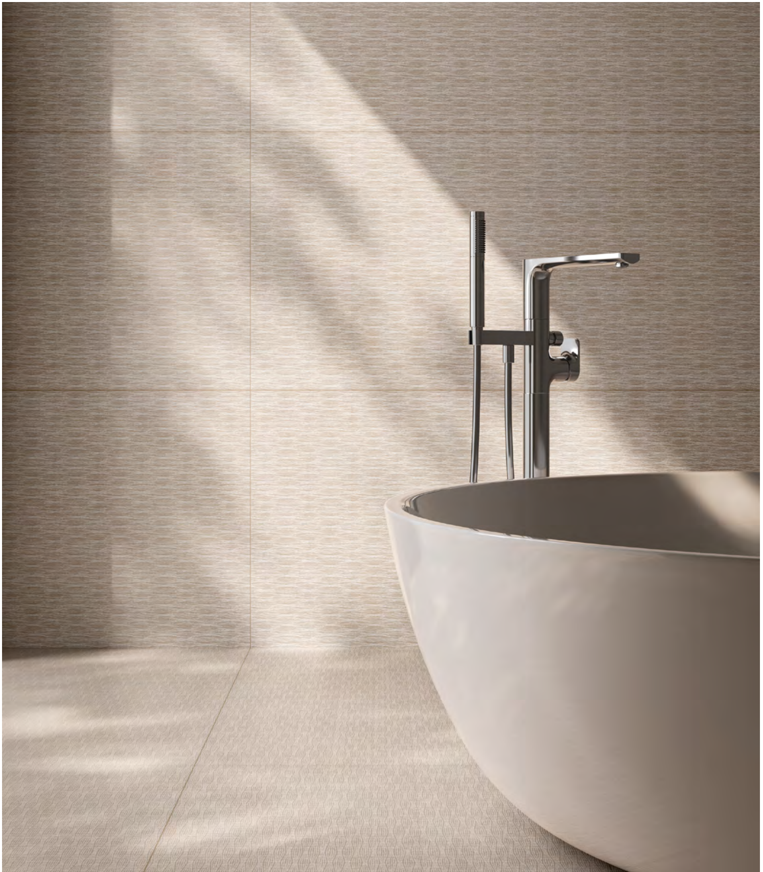
WALL: city london, metropolis sand cm 60x120 - 23 5/8 "x47 1/4 " / FLOOR: city london cm 60x120 - 23 5/8 "x47 1/4 "