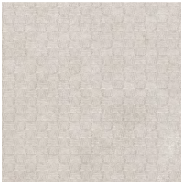
city hong kong