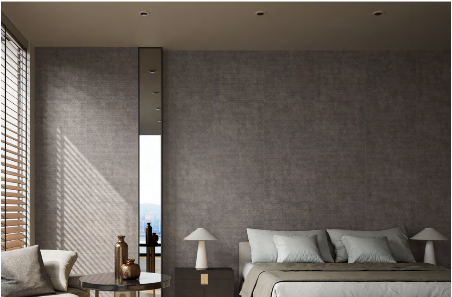
WALL: city hong kong cm 60x120 - 23 5/8 "x47 1/4 " / FLOOR: english wood higland cm 20x120 - 7 7/8 "x47 1/4 "

Caractéristiques techniques et esthétiques à la page : Technische und ästhetische Eigenschaften auf Seite: 481